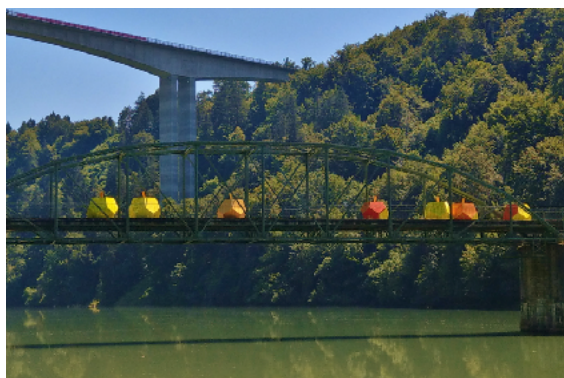
Lippitzbachbrücke mit Kunstinstallation "Verbotene Früchte" von Alex Samyi